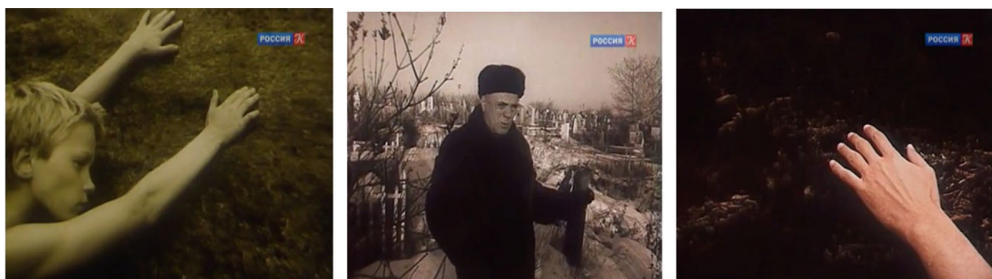
Рис. 2. Первый кадр и кадр из последней сцены в фильме Fig. 2. The first frame and the frame from the last scene in the movie

гильных плит В. П. Астафьев рассказывает о том, кто погиб из жителей Игарки и чьи мечты не были осуществлены. «Кладбище Игарки – тяжелый разговор», – говорит писатель. Далее рука соскальзывает с камня и мы видим поросшую бурьяном землю.