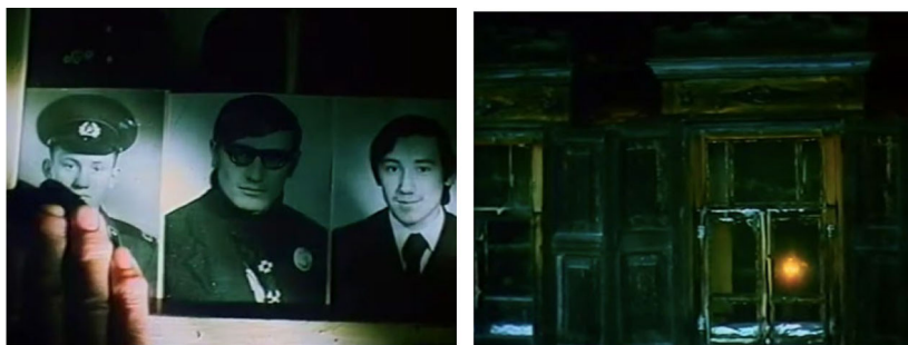
Рис. 7. Кадры «памяти» в фильме «Жили-были старик со старухой» Fig. 7. Frames of "memory" in the film "Once upon a time there was an old man with an old woman"

сын соседа, принес заказное письмо из Москвы с отказом выплаты военнопленным из средств Германского фонда «Память, ответственность и будущее». Название фонда звучит как насмешка, письмо пришло спустя два года после отправки запроса.