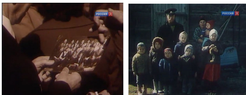
Рис. 1. Фотографические кадры из кинофильма «А прошлое кажется сном...» С. Мирошниченко Fig. 1. Photographic stills from the movie "And the past seems like a dream..." by S. Miroshnichenko

Данный фильм очень аналитичен, режиссер предпринимает попытку осмыслить произошедшее. В момент одного из интервью мы видим съемочную команду, слышим вопросы, которые задаются людям – вновь нам напоминают, что это реальная беседа. Рассказ переходит к теме музея дома Сталина в селе Курейка Туруханского района. Данный музей был создан над домиком Сталина, в котором он отбывал ссылку до революции. Красивое парадное здание над ним было возведено силами заключенных. Работали они по 12 часов в день. Из инструментов у них были только кирки да лопаты.