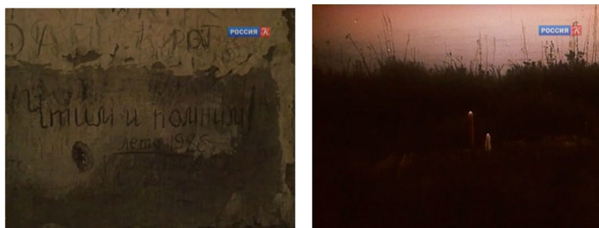
Рис. 3. Кадры «памяти» в фильме «А прошлое кажется сном...» Fig. 3. Frames of “memory” in the film “And the past seems like a dream ...”

Данный документальный фильм является ярким репрезентантом и своего времени – времени перестройки и гласности, а также репрезентантом темы «культур-