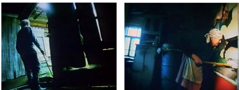
Рис. 5. Использование голландского угла в фильме «Жили-были старик со старухой» И. Зайцевой Fig. 5. The use of the Dutch angle in the film "Once upon a time there was an old man with an old woman" by I. Zaitseva

Первое воспоминание связано с супружеством. Но в основном память уносит героя к событиям Великой Отечественной войны, связанным с его уходом на фронт, службой на войне, убийством уклониста, лобовым столкновением с противником и заключением в плен.