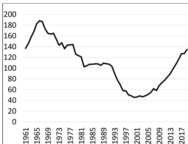
Рис. 1. Изменения поголовья домашних оленей в Красноярском крае (тыс. голов).