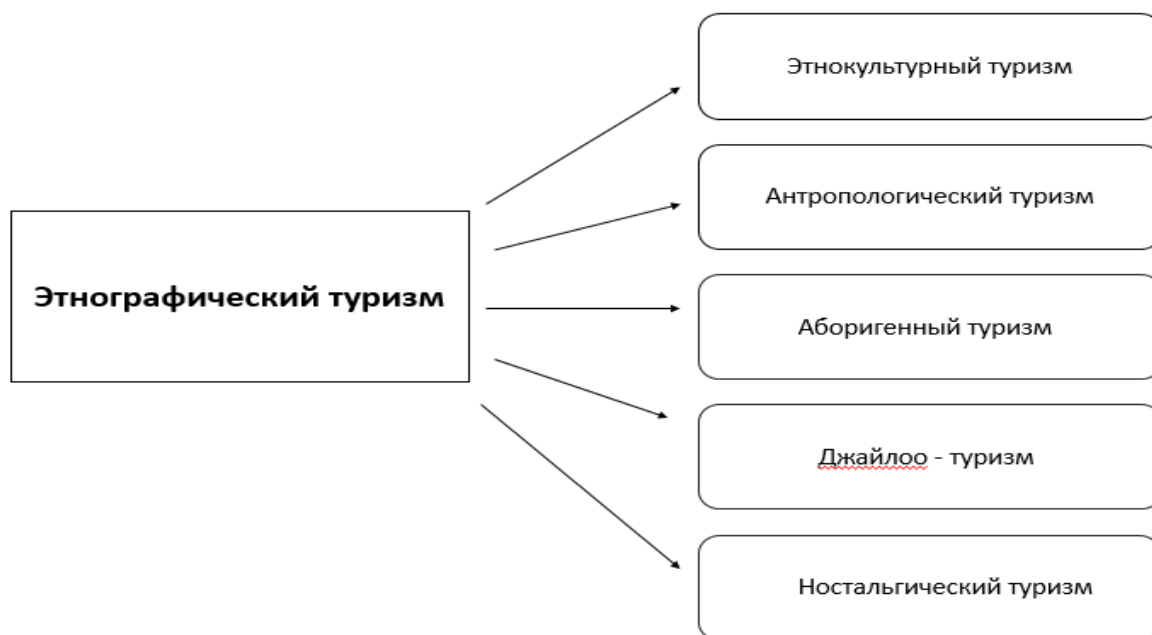
Рисунок 1 – Классификация этнографического туризма

Существует также классификация этнографического туризма, согласно которой, данный вид туризма имеет несколько разновидностей: этнокультурный туризм, антропологический, аборигенный, джайлоо – туризм, ностальгический. Классификация представлена на рисунке 1.