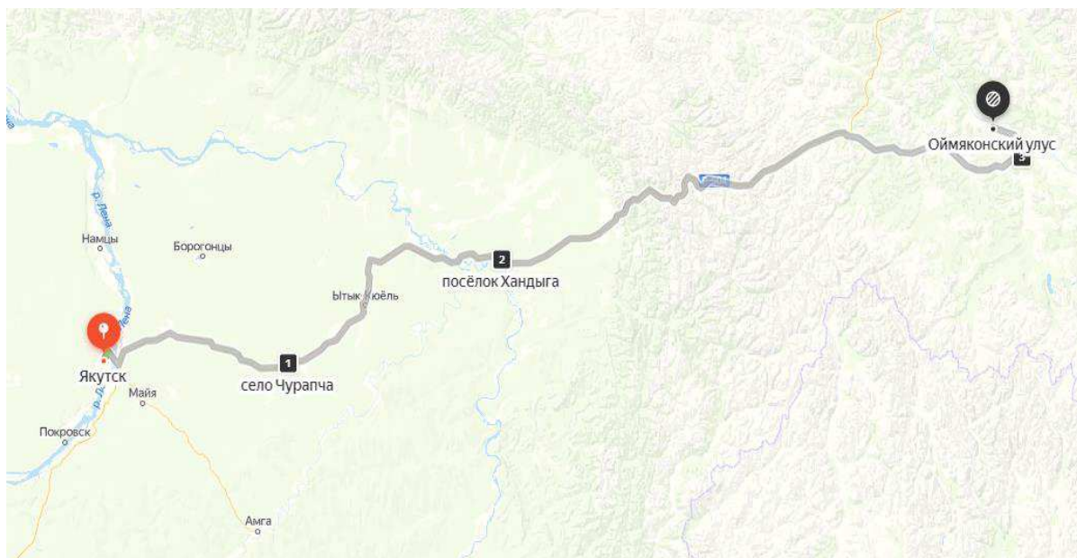
Рисунок А.1 – Схема маршрута этнографического тура