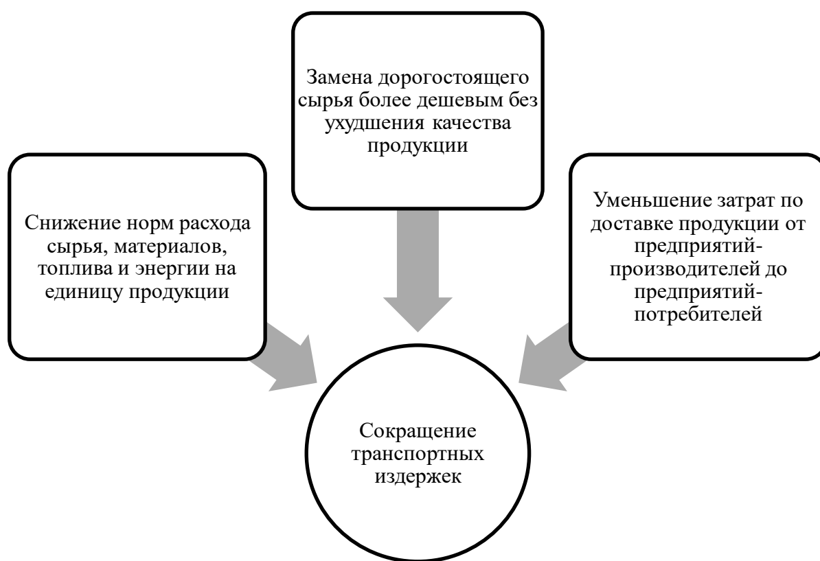
Рисунок 3 – Факторы, влияющие на сокращение транспортных издержек [17].

Улучшение использования транспорта, топлива и энергии является важной предпосылкой снижения издержек. На рисунке 3 отражены главные элементы сокращения транспортных издержек.