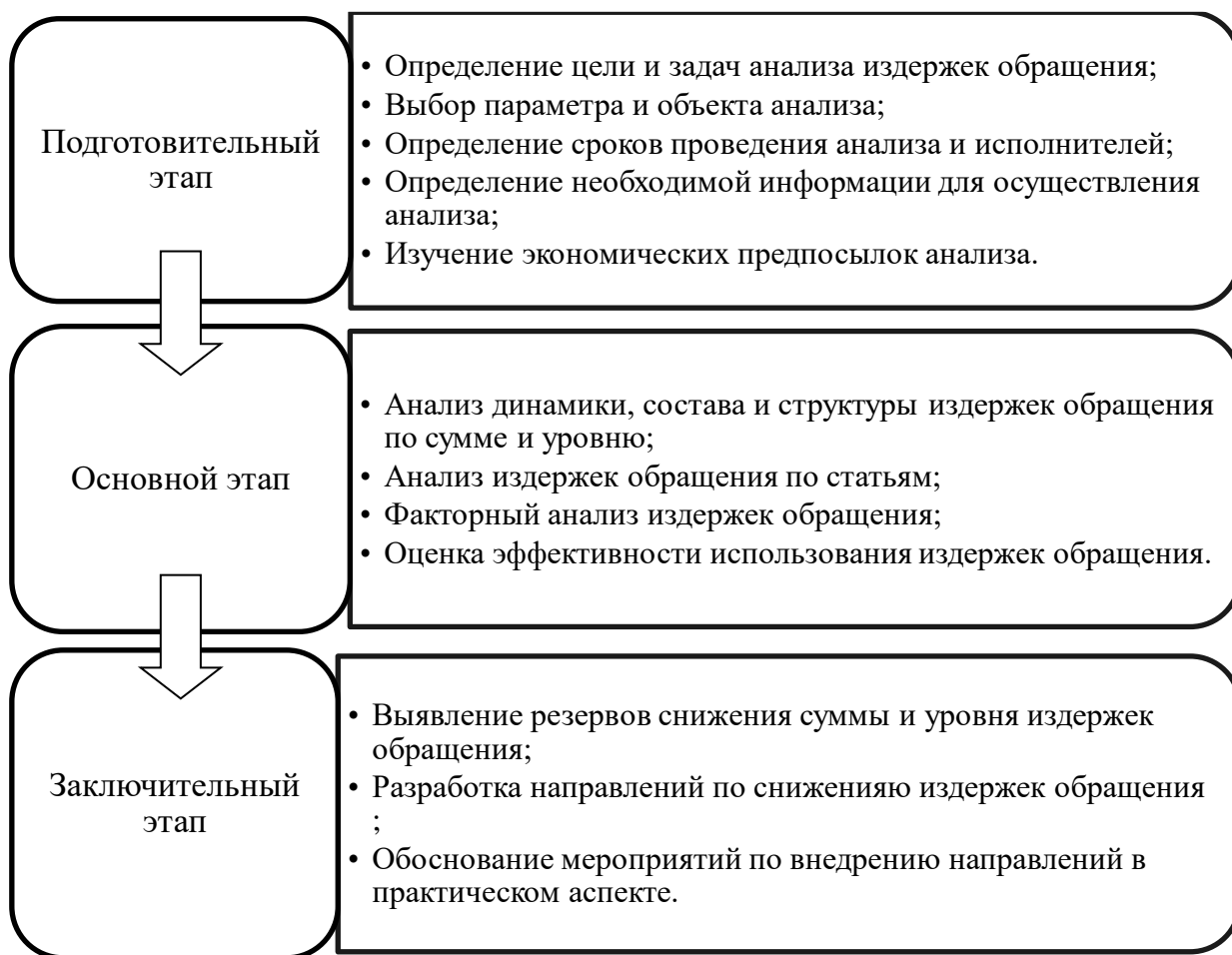
Рисунок 1 – Этапы анализа издержек обращения в торговом предприятии и их содержание

себя несколько шагов, которые позволяют осуществить всесторонний анализ издержек обращения. На рисунке 1 представлено содержание каждого этапа.