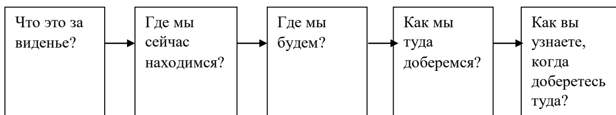
Рисунок 1 – Метод создания интерактивной среды обучения

Существует множество методик интерактивного обучения, при которых учитель предстает в роли руководителя обучающего процесса и в роли организатора, который подготавливает задания, формирует вопросы и предположительные темы для диалога с учениками. Перед учителем, при выборе методов интерактивного обучения, возникает вопрос не только в выборе качественных методов, но и насколько подходит выбранный интерактивный метод для изучения конкретных тем, и предполагает совместимость выбранных методов друг с другом, для решения задач обучения, что, в свою очередь способствует наиболее качественному пониманию учеником пройденного материала [16].