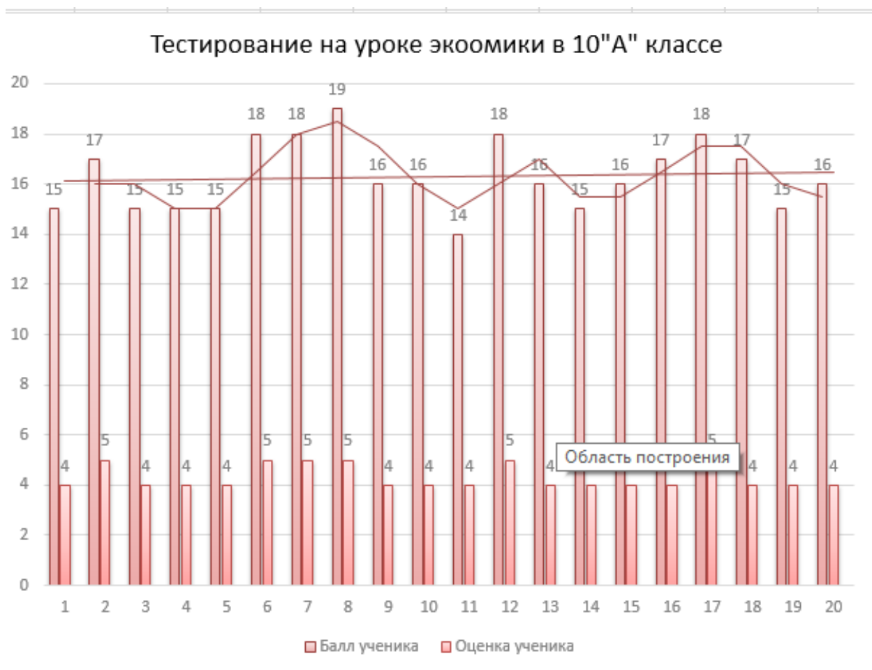
Диаграмма 1 – Диаграмма по результатам констатирующего этапа эксперимента в 10 «А»