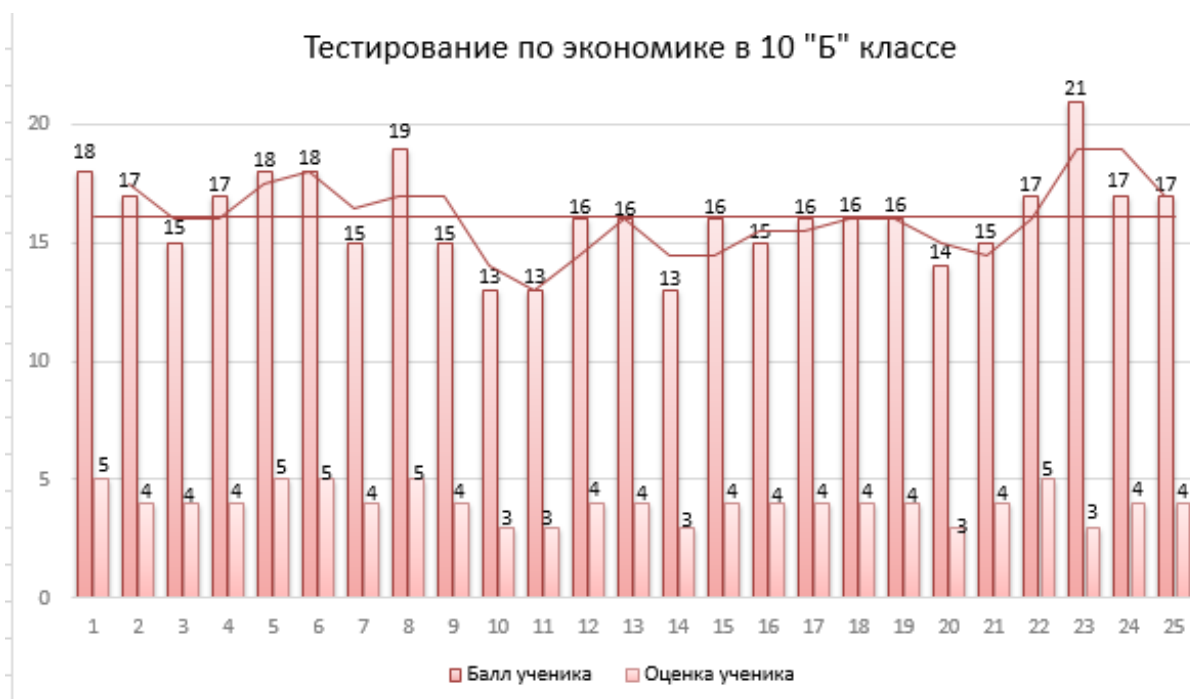
Диаграмма 7 – Диаграмма по результатам контрольного этапа эксперимента в 10 «А» классе

Таким образом, в ходе проведения контрольного этапа эксперимента, можно сделать вывод, что в 10 «А» классе и 10 «Б» классе предметные