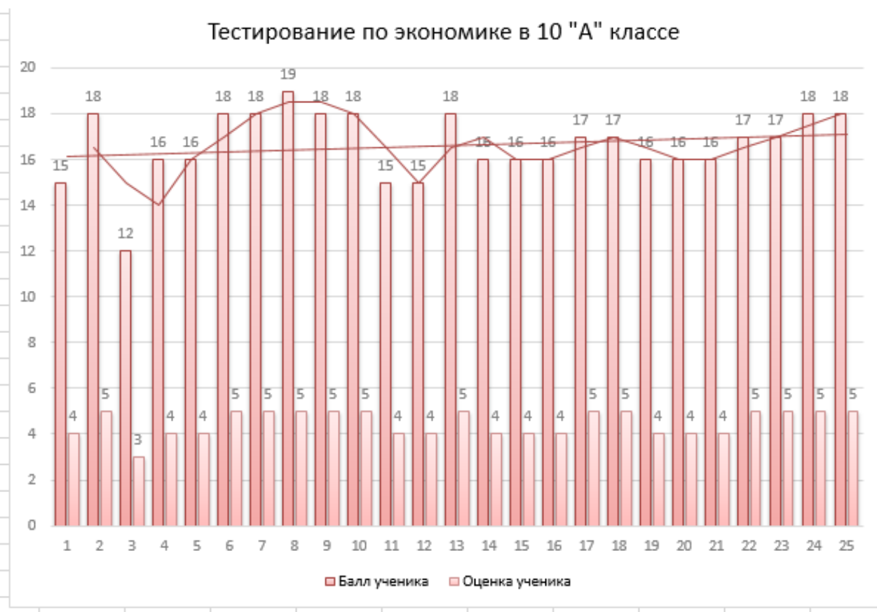
Диаграмма 6 – Диаграмма по результатам контрольного этапа эксперимента в 10 «А» классе