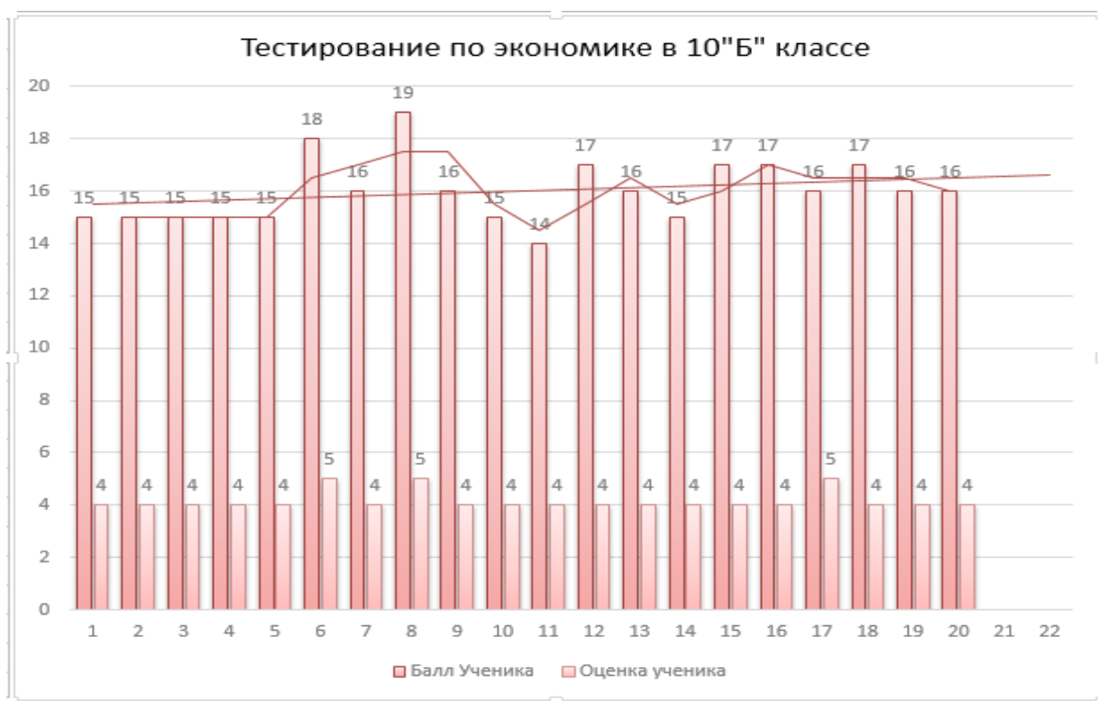
Диаграмма 2 – Диаграмма по результатам констатирующего этапа эксперимента в 10 «Б»

Таким образом, в ходе проведения констатирующего этапа эксперимента, можно сделать вывод, что в 10 «А» классе и 10 «Б» классе предметные образовательные результаты находятся на одном уровне, так как средний балл 10 «А» класса равен 16,3 балла, средняя оценка по классу 4,3, в 10 «Б» класса, общий балл по тесту равен 16, средняя оценка по классу равна 4.