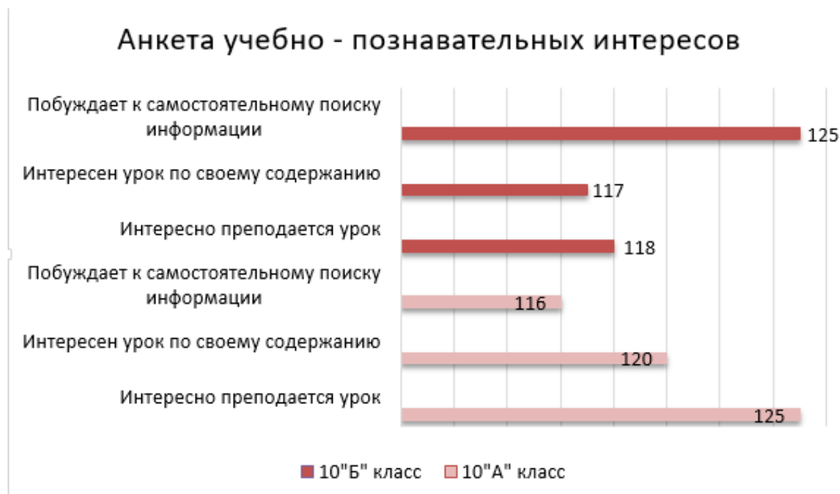
Диаграмма 5 – Диаграмма результатов анкет по учебно-познавательным интересам изучения материала

Таким образом, на данном этапе были проведены занятия по экономике с использованием различных интерактивных методов для 10 «А», таких как кейс-метод, мозговой штурм, деловая игра, ролевая игра, блиц опрос. Для 10 «Б» были проведены уроки с использованием традиционных методов, таких как беседа, объяснение, учебная дискуссия, работа с учебником, упражнение. Так же, в результатах проведенного анкетирования, стало известно, что между критериями в обоих классах, количество баллов едва различаются.