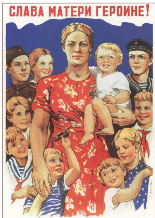
464. Ватолина Н. Слава матери-героине! 1944