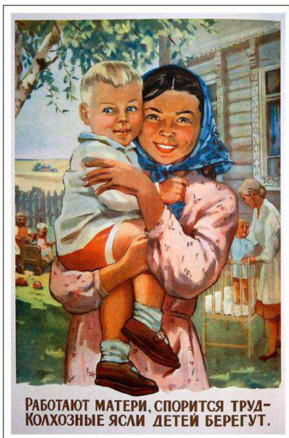
Рис. А.6. Работают матери, спорится труд – колхозные ясли детей берегут. 1955