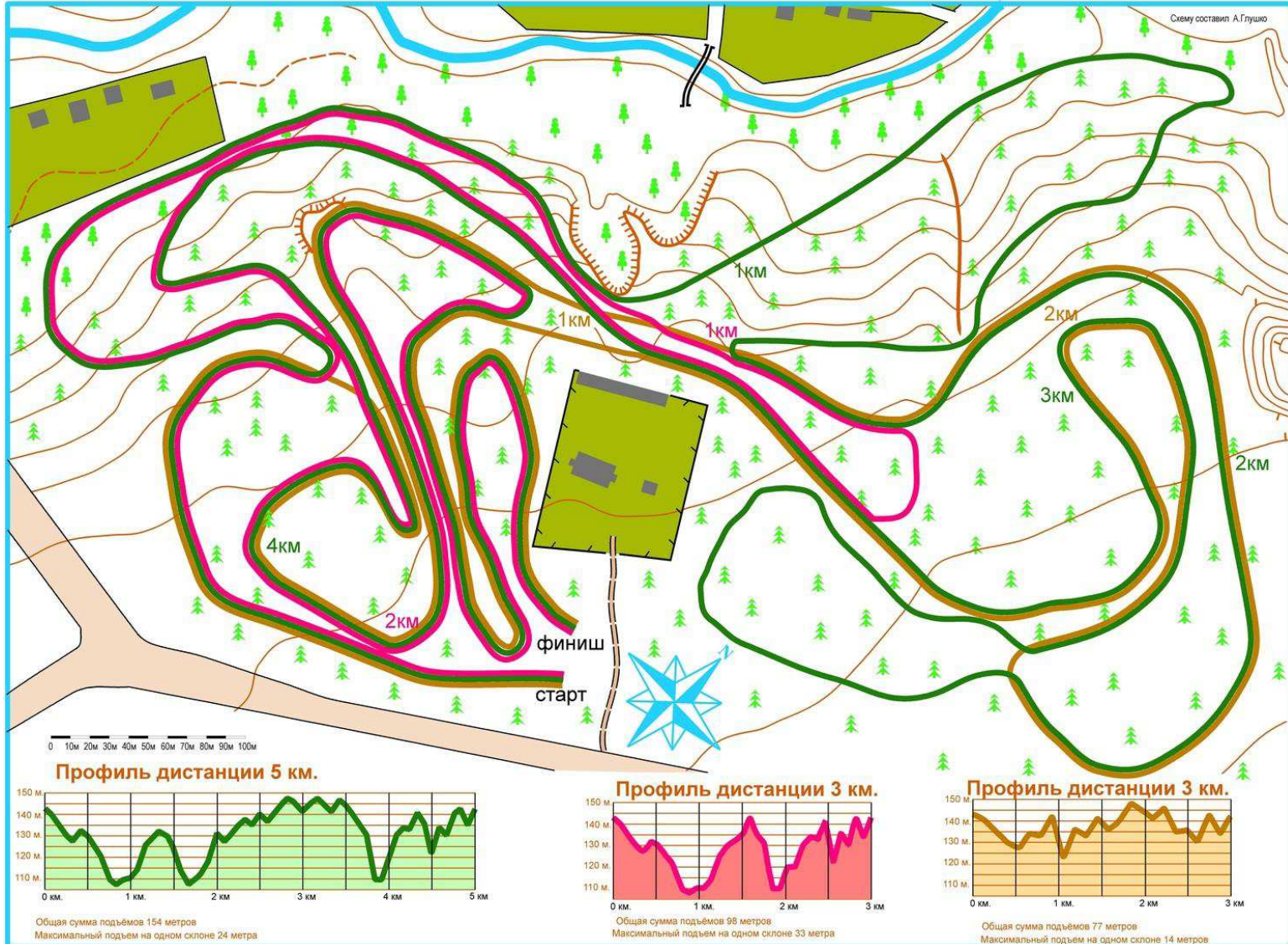
СХЕМА ЛЫЖНЫХ ТРАСС