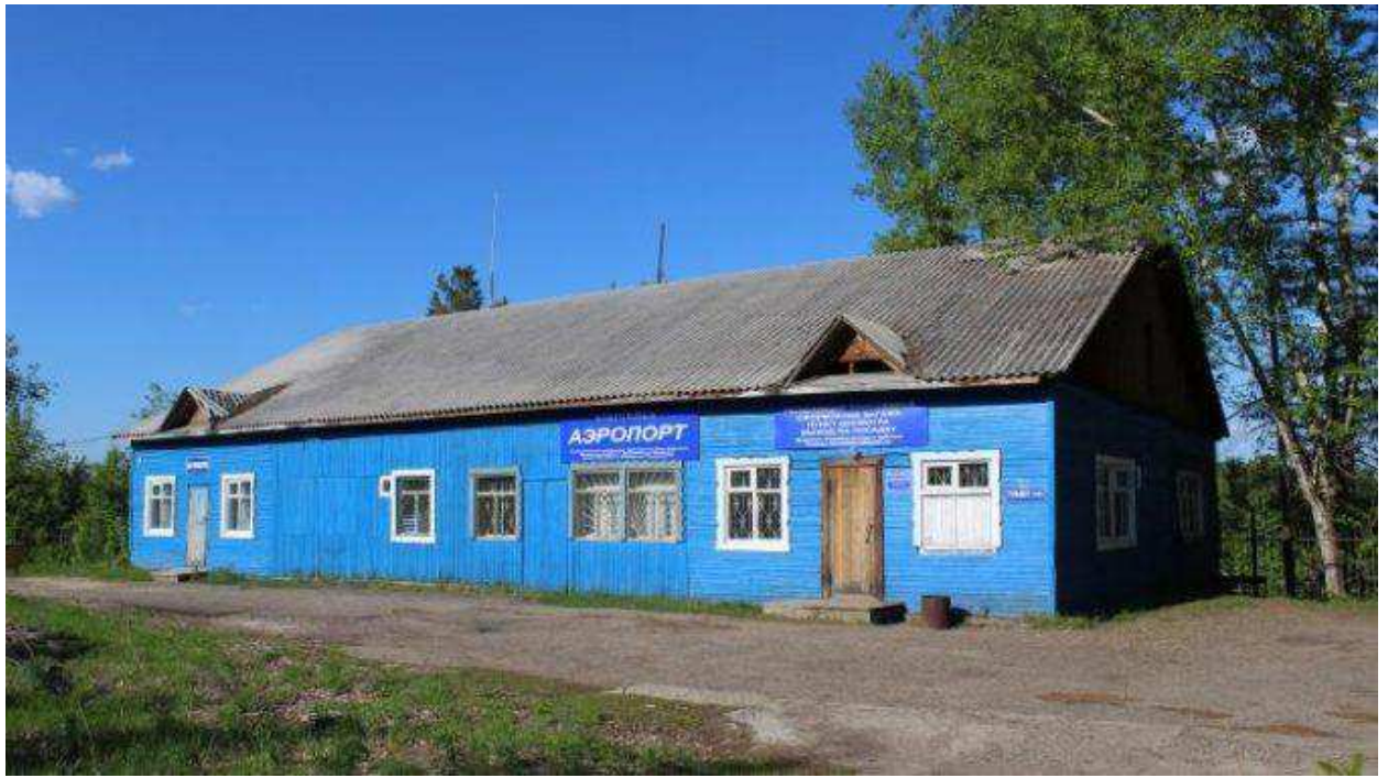
Рисунок 2 - Аэропорт города Енисейск

Аэропорт рассчитан на посадку поршневых и реактивных самолетов, но после реконструкции самого сооружения и взлетных полос, сможет иметь возможность принимать и отправлять все виды самолетов, в том числе и малой авиации. Которая бы позволила существенно увеличить трафик туристов. Сегодня из городского аэропорта регулярного пассажирского сообщения нет . Из Енисейска летают борта Авиалесоохраны и других ведомств, осуществляются санитарные рейсы. Прямой рейс позволит значительно сократить время в пути. Даже такие мини-лайнеры, как Л-410 долетят из краевого центра до Енисейска за полтора часа - вместо четырех-пяти часов на автомобиле. Без пассажиров планируемый авиамаршрут не останется.