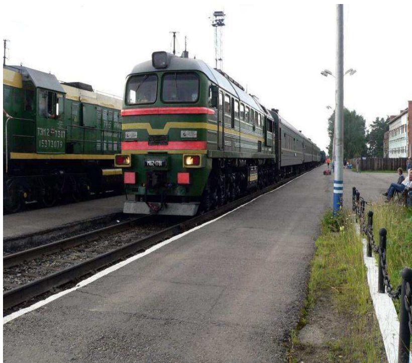
Рисунок 3 - Электричка до г. Енисейск

2) В Енисейск на рейсовом автобусе. В Енисейск ходят рейсовые автобусы из Красноярска и Лесосибирска (рис. 4). Адрес автовокзала: Енисейск, ул. Рабоче-Крестьянская, 86. Телефон для справок: +7 (39115) 23-250, 22-057, время в пути 7 часов.