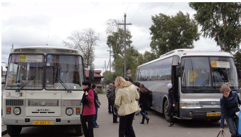
Рисунок 4 - Рейсовый автобус до г. Енисейск.

2) В Енисейск на рейсовом автобусе. В Енисейск ходят рейсовые автобусы из Красноярска и Лесосибирска (рис. 4). Адрес автовокзала: Енисейск, ул. Рабоче-Крестьянская, 86. Телефон для справок: +7 (39115) 23-250, 22-057, время в пути 7 часов.