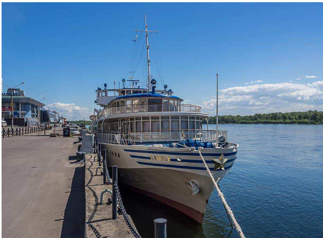
Рисунок 5 - Теплоход В. Чкалов

4) В Енисейск на теплоходе. С июня по октябрь до Енисейска из Красноярска ходят теплоходы А.Матросов, В.Чкалов, Лермонтов, Близняк , а с недавнего времени станет ходить пятизвездочный лайнер «Максим Горький» (рис. 5). Телефон для справок: +7 (391) 259-18-32 (время в пути 17 часов).