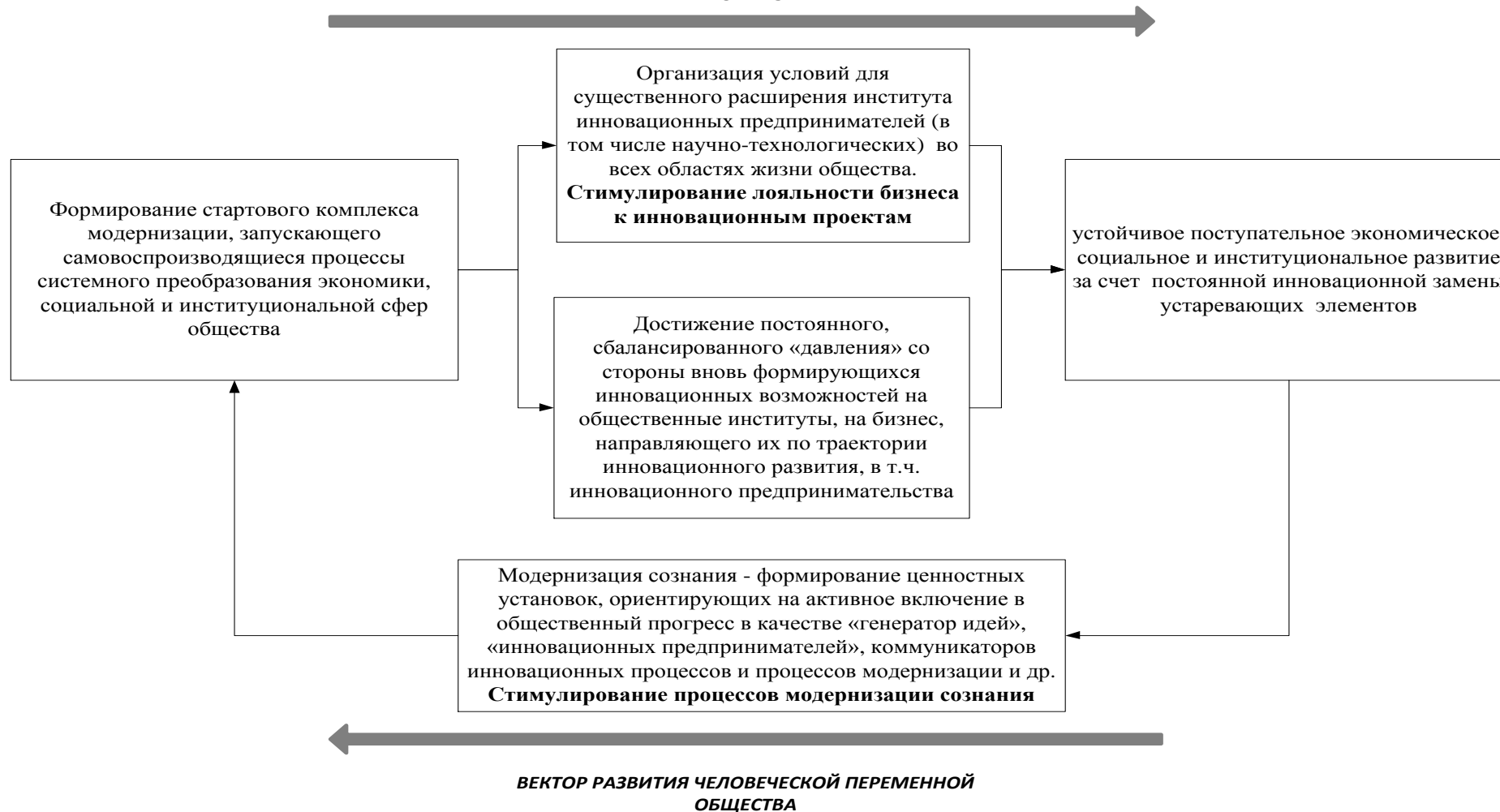
Рисунок 2. Структурно-Логическая Модель Цикла Модернизации ОРГАНИЗАЦИОННО-ИНСТИТУЦИОНАЛЬНЫЙ ВЕКТОР РАЗВИТИЯ