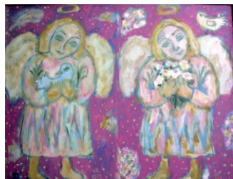
Рис. 2. И. Ю. Верпета «Маленькие ангелы», 83×105, X., м. 2012 г.

канал строится» (рис. 3, 4) можно определить как стилизованный под народное творчество «рассказ в картинках» о жизни строителей канала. Во всех работах происходит погружение в субъективную реальность через атрибуты легко узнаваемой объективной реальности. Стилистика примитивистского произведения позволяет легко совмещать несовместимые в действительности объективные и субъективные миры в пространстве картины.