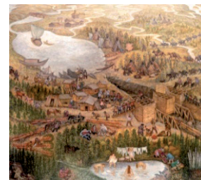
Рис. 3. В. Ф. Капелько «Обь-Енисейский канал строится» 1988 X., м. Из собрания КХМ им. В. И. Сурикова

Разработанное в современной философии понятие «субъективной реальности субъекта (в частности человека) включает все, что субъект чувствует, о чем догадывается и что помнит. <...> Механизм ощущения реальности субъекта самостоятельно формирует трехмерную объектно-ориентированную чувственно-геометрическую модель реальности — одну из бесконечного числа возможных моделей. То есть за ощущениями закрепляется работа по созданию картины мира во всей воспринимаемой ее полноте» [3]. Картина мира, сформированная в произведениях живописи, постепенно обретает