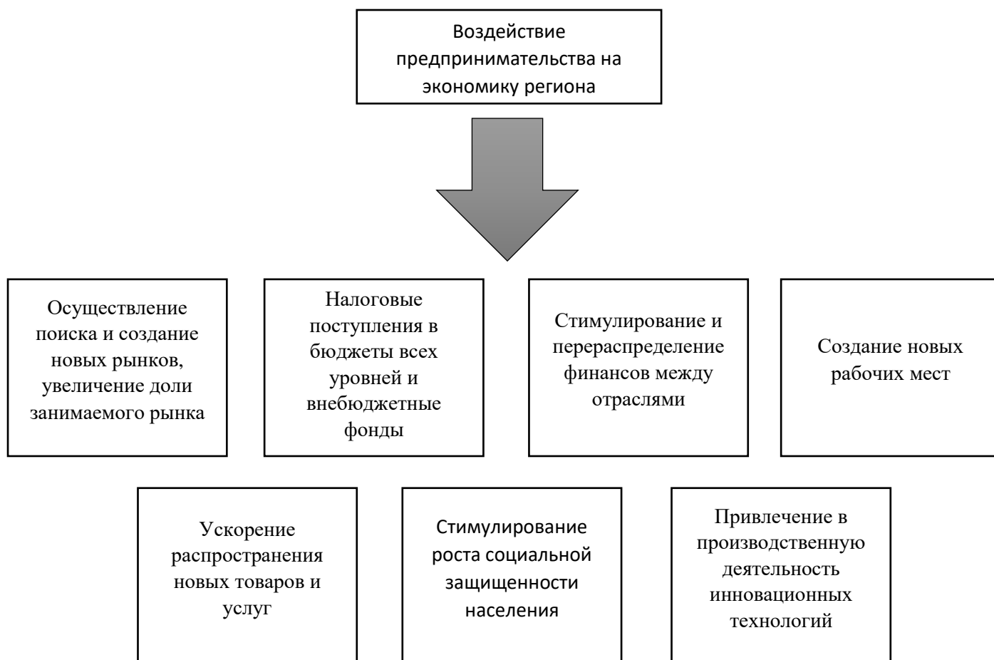
Рисунок 1 - Воздействие предпринимательства на экономику государства

Предпринимательство важное влияние на экономику региона и государства в целом. Отообразим это в схеме: