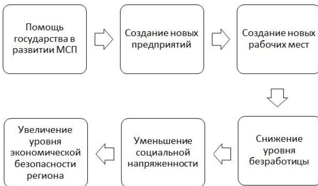
Рисунок 3 - Влияние поддержки государства в развитии малого и среднего предпринимательства

государством МСП и увеличение уровня экономической безопасности региона представлена ниже.