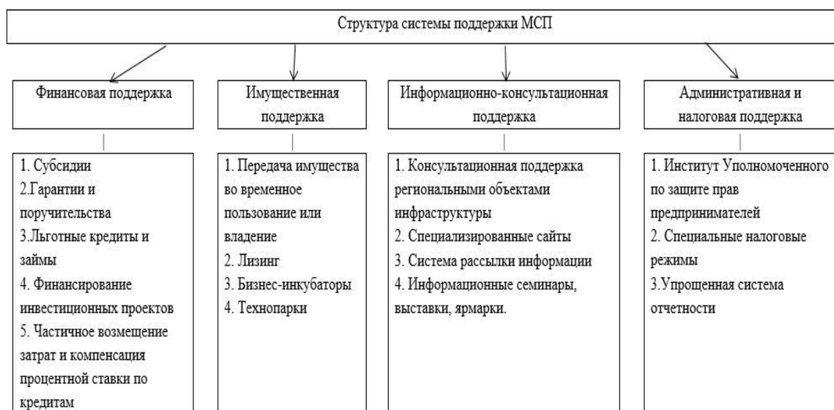
Рисунок 2 - Структура системы поддержки малого и среднего предпринимательства

Российская Федерация на данный момент обладает всеми видами структуры поддержки малого предпринимательства, которые имеют промышленно развитые страны. Механизмов по предоставлению поддержки малого и среднего предпринимательства существует достаточно и их можно выделить в 4 основных категории представленных в рисунке 2.