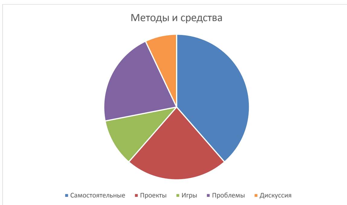
Рисунок 3 – Методы и средства

Умение учиться формируют различными методами. Через самостоятельные работы в 6-ти случаях. Так же определение учебной самостоятельности через её компоненты в основном формируется так же через самостоятельные работы. Авторы статей про познавательную самостоятельность прибегают к такому средству всего 3 раза.