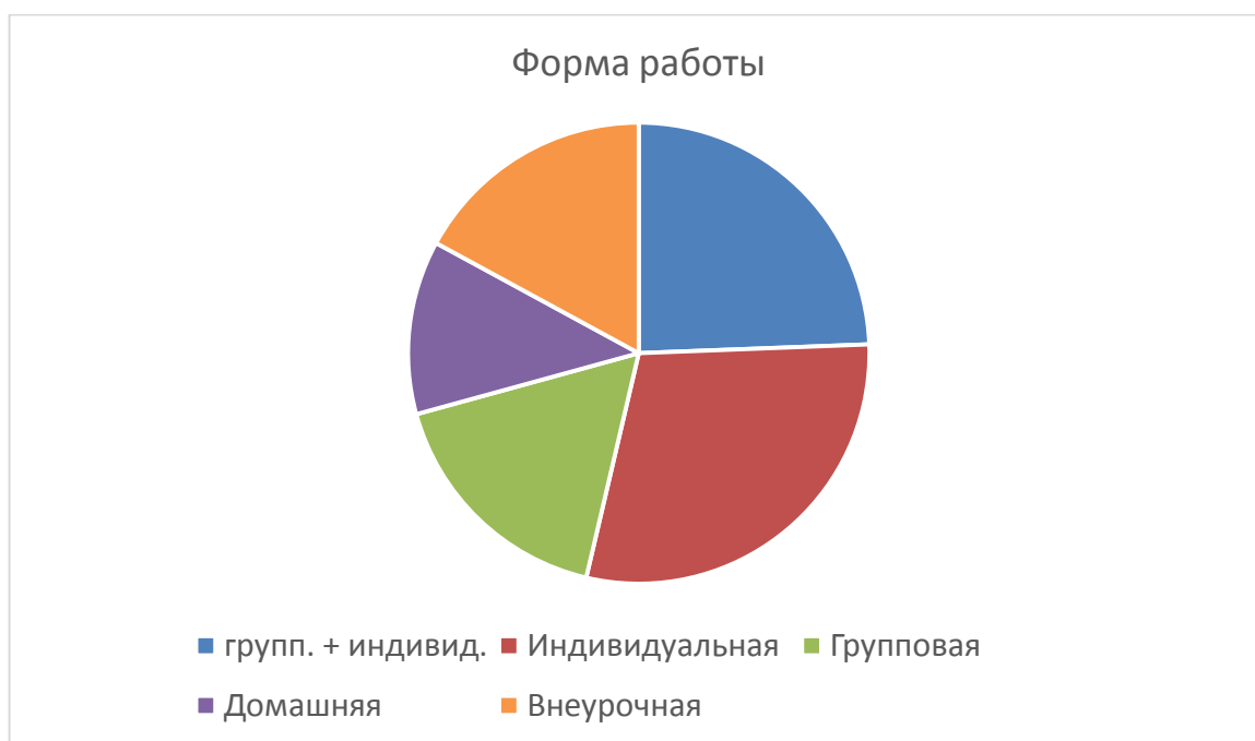
Рисунок 2 – Форма работы

Групповая и индивидуальная работа вместе всегда сопутствует с 3 строкой из таблицы №1, так же встречается в 4х статьях про познавательную самостоятельность и всего 2 раза в случае умения учить себя.