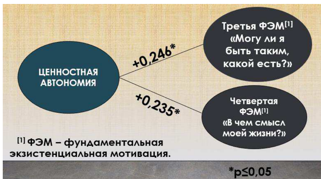
Рисунок 2 — взаимосвязь ценностной автономии с третьей и четвертой фундаментальными экзистенциальными мотивациями

Таким образом, вторая гипотеза подтвердилась: взаимосвязи между ценностной автономией и третьей и четвертой фундаментальными экзистенциальными мотивациями, имеющими отношение к ценностям и смыслу жизни, являются статистически значимыми (при p \leq 0,05 ), частные альтернативные гипотезы принимаются, нулевые отвергаются. Это отображено на рисунке 2: