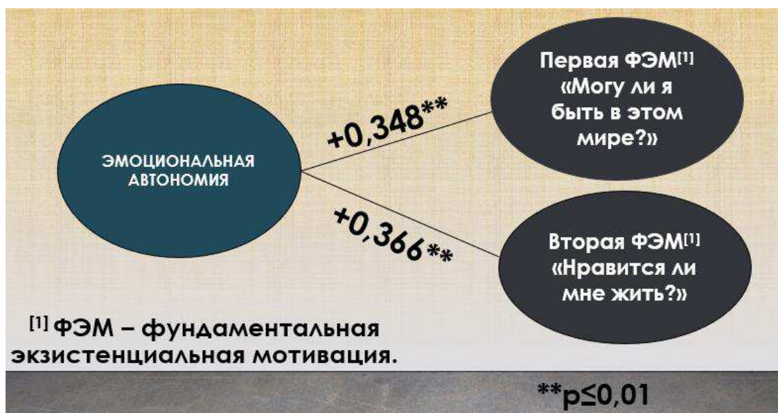
Рисунок 1 — взаимосвязь эмоциональной автономии с первой и второй фундаментальными экзистенциальными мотивациями

Частные гипотезы H_1 принимаются, H_0 отвергаются. Это можно продемонстрировать следующим рисунком: