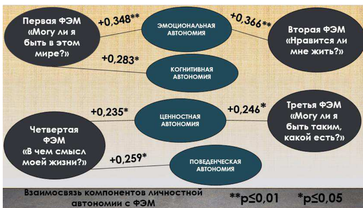
Рисунок 5 — взаимосвязь компонентов личностной автономии с фундаментальными экзистенциальными мотивациями.

В заключение данного параграфа представим общий рисунок получившихся взаимосвязей: