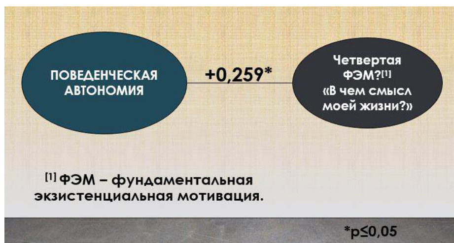
Рисунок 4 — взаимосвязь поведенческой автономии с четвертой фундаментальной экзистенциальной мотивацией

Таким образом, четвертая гипотеза подтвердилась: взаимосвязь между поведенческой автономией и четвертой фундаментальной экзистенциальной мотивацией, относящейся к вопросам будущего, вопросам целеполагания, является статистически значимой (при p \leq 0,05 ), частная альтернативная гипотеза принимается, нулевая отвергается. Это отображено на рисунке 4: