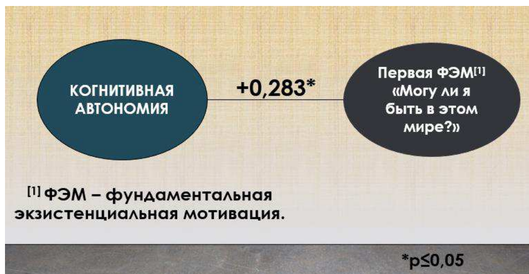
Рисунок 3 — взаимосвязь когнитивной автономии с первой фундаментальной экзистенциальной мотивацией

Третья гипотеза подтвердилась: когнитивная автономия положительно значимо связана с первой фундаментальной экзистенциальной мотивацией, касающейся свободы по отношению к собственным мыслям (при p \leq 0,05 ). Частная гипотеза H1 принимается, H0 отвергается. Это можно продемонстрировать следующим рисунком: