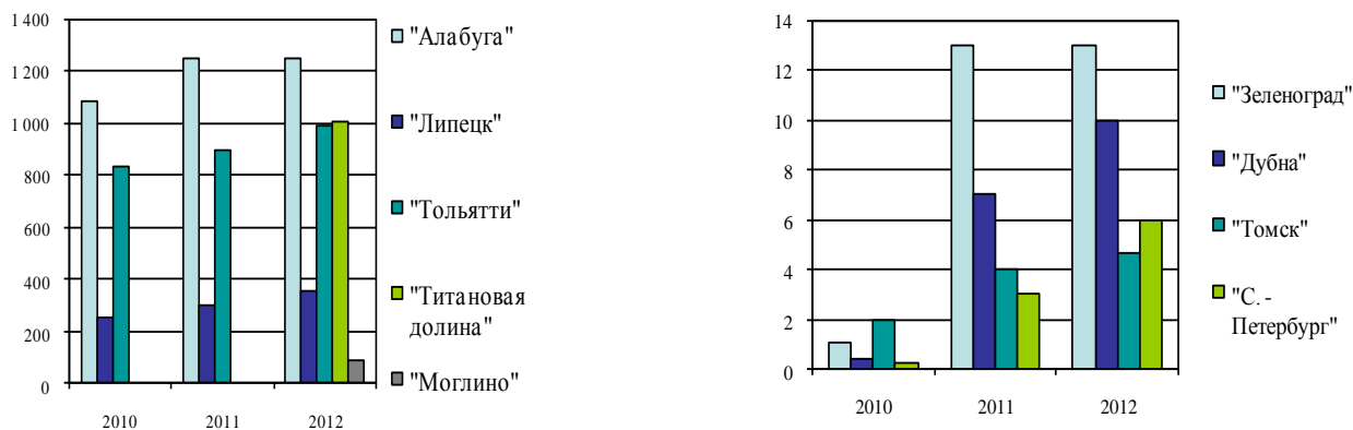
Рисунок 2 – Сравнительные показатели инвестиций (частных и государственных) в промышленно-производственные ОЭЗ (слева) и технико-внедренческие (справа), в млрд. руб. (составлено авторами по данным источников [3,4])

Из приведенных выше графиков видно, что, несмотря на очевидные разрывы между различными особыми экономическими зонами в группах, наблюдается устойчивый рост валового товарооборота, а также увеличение размера инвестиций. Все это может свидетельствовать о развитии зон данных двух типов. Среди зон промышленно-производственного типа, как самые перспективные на данный момент,