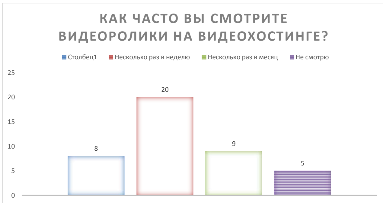
Рисунок 1- Вопрос 2 «Как часто вы смотрите видеоролики на видеохостингах Vine, YouTube, Twitch.tv и т.д»

Как мы видим из рисунка 2, ответы на данный вопрос оказались самыми разными. Данный вопрос был с возможностью выбора нескольких вариантов ответов из списка. Результаты оказались следующими: вариант «каждый день» выбрала 8 из 42 респондентов, наиболее популярным оказался вариант «Несколько раз в неделю», который выбрали 20 опрошенных из 42, вариант «Несколько раз в месяц» выбрала 9 респондентов, а наименее популярным оказался вариант «не смотрю», который выбрали только пять респондентов из 42.