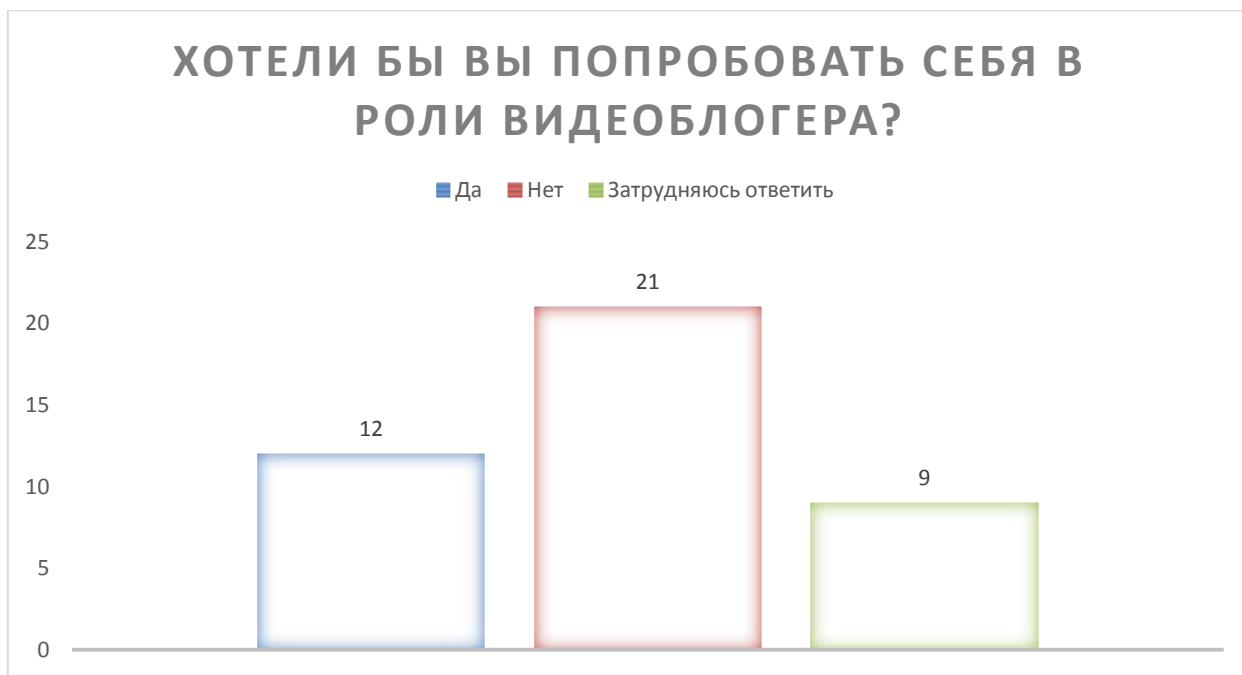
Рисунок 2- Вопрос 3 «Хотели бы вы попробовать себя в роли видеоблогера»

Исходя из диаграммы, мы можем увидеть, что половина респондентов выбрала вариант «нет» – двадцать один человек из двенадцати. Девять человек не смогли однозначно ответить на поставленный вопрос и выбрали вариант «затрудняюсь ответить». И только двенадцать опрошенных из сказали о том, что они заинтересованы попробовать себя в роли видеоблогера.