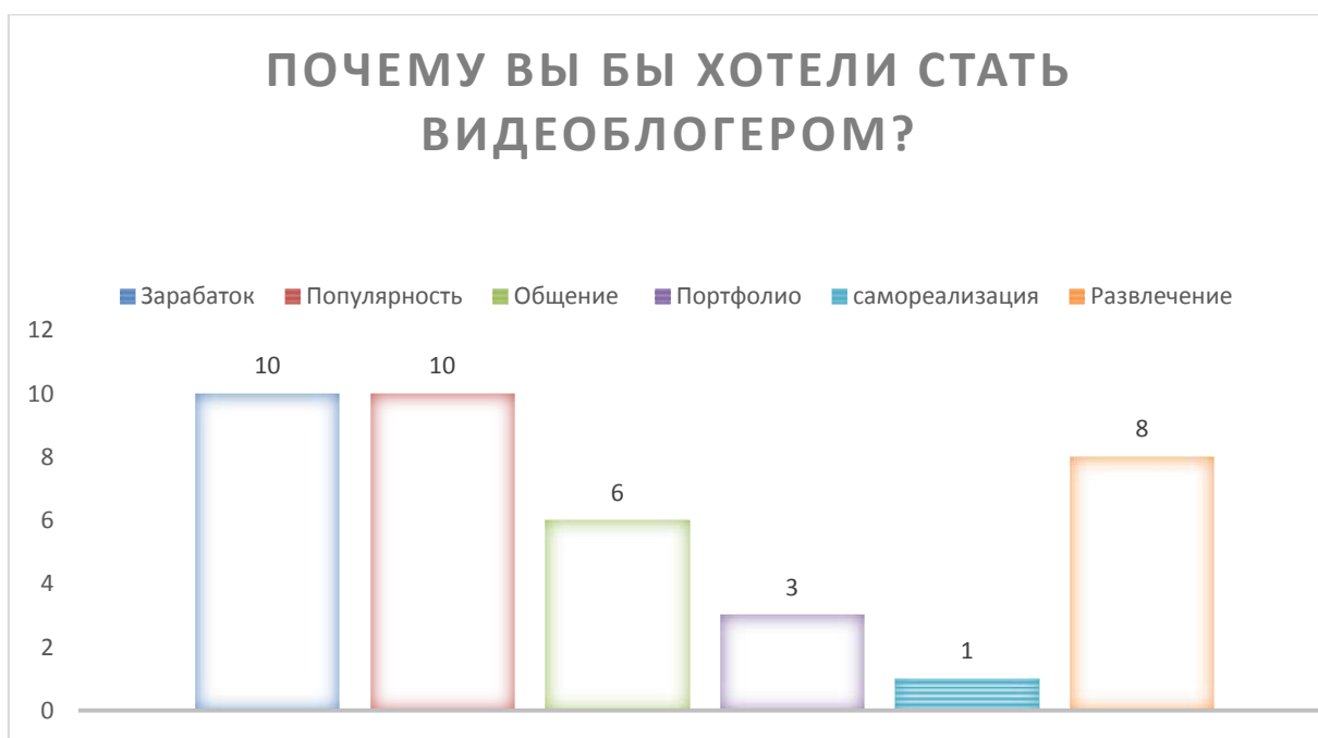
Рисунок 3 - Вопрос 4 «Почему вы бы хотели стать видеоблогером»

Как мы видим из рисунка 3, ответы на данный вопрос оказались самыми разными. Данный вопрос был с возможностью выбора нескольких вариантов ответов из списка, а также с возможностью добавить свой вариант ответа в пункт «другое». Самым популярным вариантом ответа оказались «заработок» и «популярность», их выбрали десять респондентов из двенадцати. Вариант «развлечение» был выбран восьмью опрошенными, вариант «общение и новые знакомства» шесть человек. Самыми не популярными оказались варианты «портфолио», и «самореализация» их выбрала три и один опрошенный соответственно.