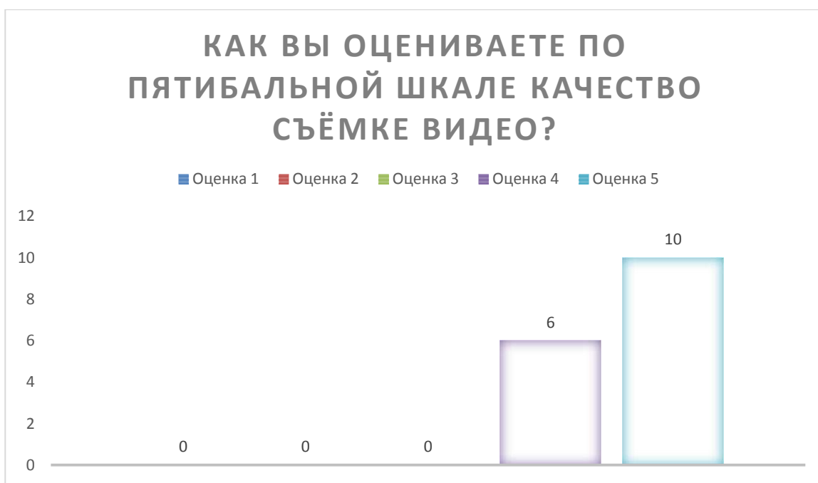
Рисунок 6 – Вопрос 2 «Оцените по пятибалльной шкале качество съёмке??».

Из диаграммы, расположенной выше мы можем узнать, что шесть человека выбрали вариант «4», а десять респондентов вариант «5». не выбрал вариант ответа «1», «2» и «3».