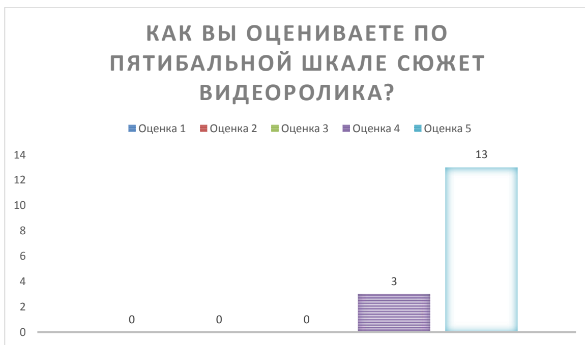
Рисунок 5 – Вопрос 1 «Оцените по пятибалльной шкале сюжет видеоролика?».

Вопрос первый «Оцените по пятибалльной шкале сюжет видеоролика?». На данный вопрос нужно было выбрать вариант ответа один из списка. Ответы можно посмотреть на рисунке