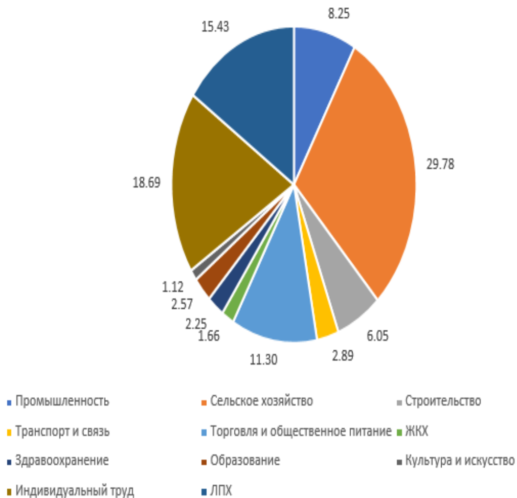
Рисунок А.1 – Структура занятости населения по отраслям экономики в 2018г.

Структура занятости населения по отраслям экономики в 2018г.