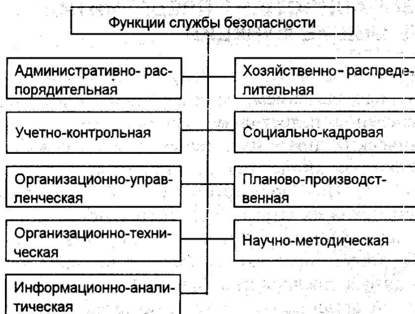
Рисунок 1 - Функции службы безопасности в организации

безопасности и выделении из всего комплекса тех, которые наиболее адекватно соответствуют производственно-коммерческой деятельности организации. Приведем наиболее полный перечень функций, выполняемых службами экономической безопасности с привлечением специалистов организации (рисунок 1).